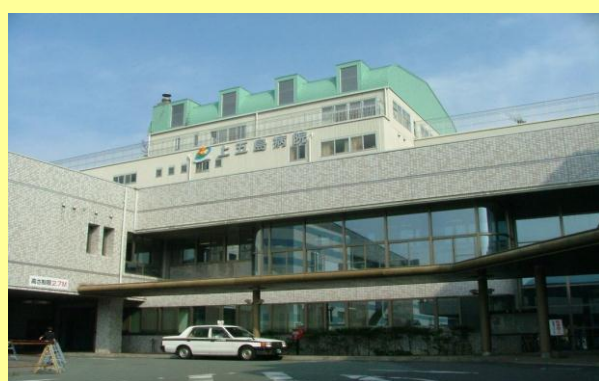
受入れ施設の一例 長崎県 上五島病院